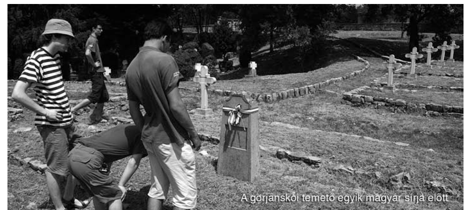
A görjanskői temető egyik magyar sírja előtt