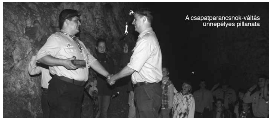
A csapatparancsnok-váltás ünnepélyes pillanata

Gyorsan lebontottuk alvóhelyünket, és megreggeliztünk. Azután a próbaútvonalán visszatértünk Budakalászra. Onnan HÉV-vel mentünk a Batthyány térre, ahol egy jó palacsintázással zártuk le a napot. Vakond ōrs